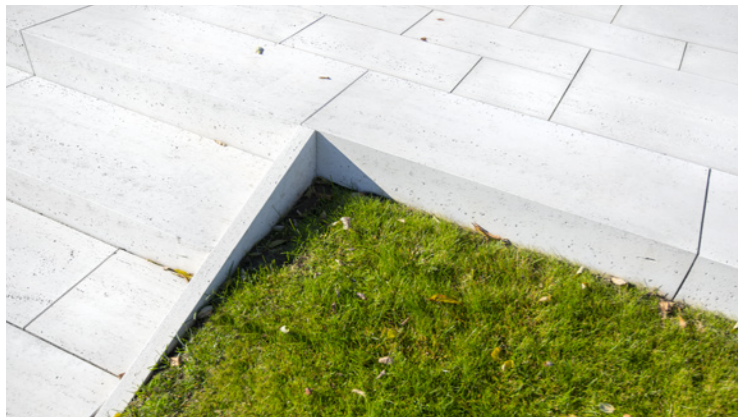
Schodišťový blok Travertino – Natur reliéfní Slonovinová