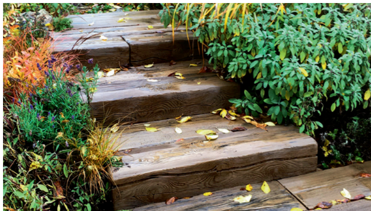
Schodišťový blok 100, Schodišťový blok 50 a Prkno 100 – Natur reliéfní Staré dřevo