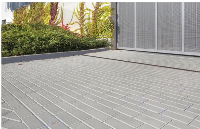
Vsakovací Parketa – Standard Přírodní