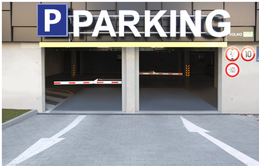
Vsakovací Ičko 8 – Standard Přírodní